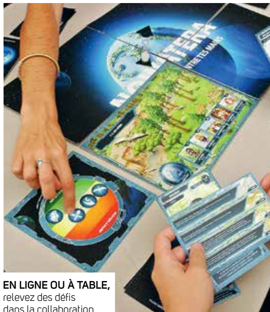
EN LIGNE OU À TABLE, relevez des défis dans la collaboration.